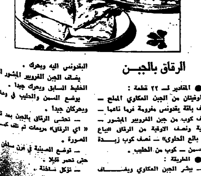
يقدمون اليه ويحرك . يضاف الجبن الغروي المشور الساقط السابق ويحرك جيدا . يوضع اللبن والحليب في وعاء ويحرك جيدا . تحشى الرقاق بالجبين بعد تقطيعه ( اي الرقاق) مرمعا ثم تلف بحشا في الصورة . توضع الصنعة في فرن ساخن وتترك حتى تصير قليلا . تؤكل ساخنة .